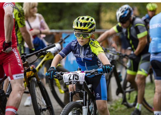
Sportuj s námi