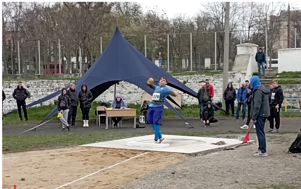
Mnozí ukrajinští sportovci se připravují a soutěží v náročných podmínkách

A co pro to udělal? Řeknu vám, co jsem si zatím nechával pro sebe. V zimě, když to začínalo být téma, jsme napsali výzvu olympijskému výboru,