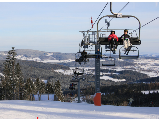
Lyžařský areál Zadov

Bylo to divadlo, bojkot není přece tím hlavním tématem. Proč pan Kejval nesvolal olympijské svazy a neprobral to s nimi? Proč neinformoval svazy, o co se hraje, a proč jim neporadil, jak mají postupovat? Právě jednotlivé národní svazy mohou napsat svým mezinárodním federacím, že Česko je proti návratu Rusů v jakékoliv podobě, kterou do té doby navrhoval MOV.